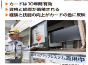
▲実際の運用シーン